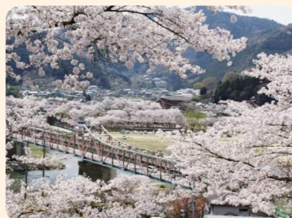
(笠置町 満開の桜と笠置大橋)