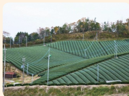
(南山城村 高尾の茶畑)