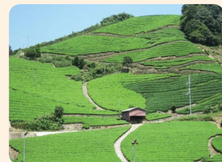
(和束町 石寺の茶畑)